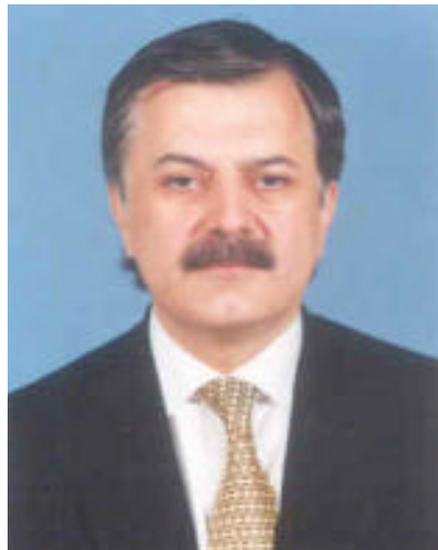
H.E. Humayun Akhtar Khan, Minister of Commerce of the Islamic Republic of Pakistan

H.R.: Privatization has become an important issue in Pakistan as well as in most of the countries of our region. What are the sectors chosen for privatization in Pakistan? To what extent has the government been able to implement its privatization programme?