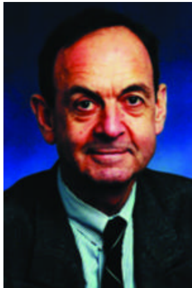
Dr. Rudolf Schmidt, Ambassador of the Federal Republic of Germany to the Republic of Turkey

According to the Unicef report in 2000 "The progress of regions in Turkey", the majority of households has access to safe water (73,8% in 1998). The need for new investments in water infrastructure is continuously increasing in urban centers due to growth rates of inhabitants above the average of 1,5%, which are caused mainly by migration from rural areas. The great task is now to reduce the disparities among the different regions. Especially in rural areas there is a great need for developing the drinking water and the waste water infrastructure. According to the General Directorate for Rural Affairs 52% of the countrywide 76.400 villages are connected to a drinking water system, 35% of the villages cover their water requirements through wells. Also the development of tourism as well as a growing living standard contribute to an increased water consumption and consequently require the extension of the facilities. The State Planning Organization has identified the need for