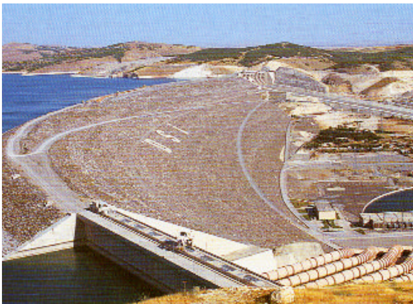
South-Eastern Anatolia Project (GAP)