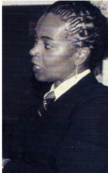
Gina Abercrombie-Winstanley, US General Consul in Jeddah, Kingdom of Saudi Arabia

SC: Regarding the new immigration regulation which is required of Saudis entering the United States, to what extent do you believe this is necessary and to what extent does it contribute to combating terrorism in the US?