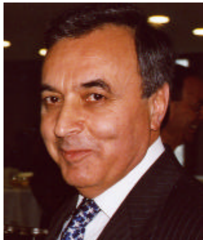
Alev Kiliç, Undersecretary of Economic Affairs, Ministry of Foreign Affairs of the Republic of Turkey

Consequently BOTAS signed a series of natural gas agreements taking into consideration the need for diversification within the framework of energy supply security and the internal demand dynamics. In addition to the East-West Energy Corridor concept which is based on the construction of trans-Caspian and trans-Caucasian oil and gas pipelines traversing Georgia and ending in Turkey (the Baku-Tbilisi-Ceyhan (BTC) Crude Oil Pipeline, South Caucasian Natural Gas Pipeline (Baku-Tbilisi-Erzurum Natural Gas Pipeline) and Turkmenistan-Turkey-Europe Gas Pipeline projects),